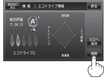
(例)エコドライブ情報画面

: 選択した評価履歴を削除してもいいかどうかの確認メッセージが表示されるので はい をタッチすると履歴を削除し、評価履歴画面に戻ります。