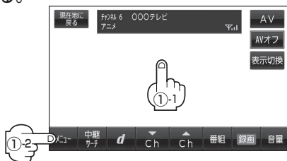
(例)テレビ視聴(ワンセグ)画面