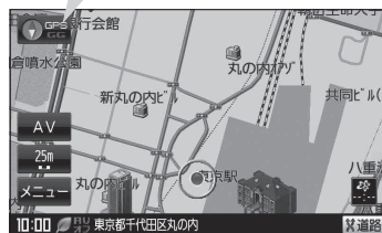
(例) 現在地表示画面