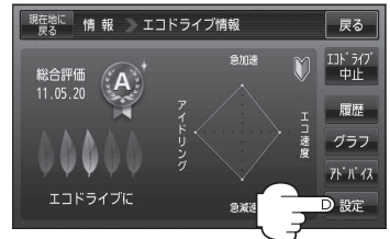
(例)エコドライブ情報画面