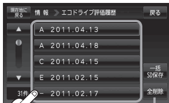
(例)エコドライブ評価履歴画面