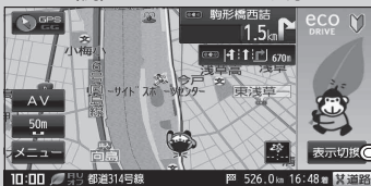
(例) アニメーションを表示