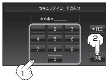
セキュリティコード入力画面

※メッセージが表示された場合は、メッセージを確認し OK をタッチしてください。