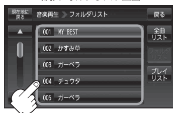
(例)フォルダリスト画面