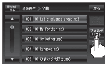
(例)全曲リスト画面