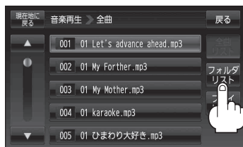
(例)全曲リスト画面