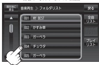
(例)フォルダリスト画面