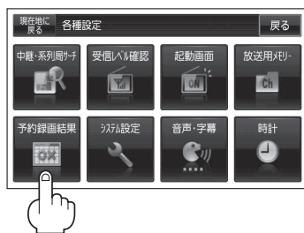
(例) 予約録画結果画面