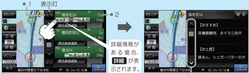
情報の続きを表示