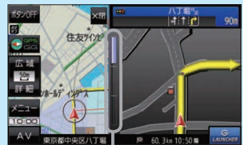
(例)交差点拡大表示