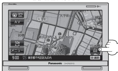
(例) 地図横表示画面