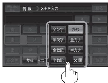
(例) 全カナ を選択した場合