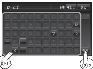
ジャンル名入力画面* 1

お知らせ * 1印…50音入力画面を選択することができます。☞ 「50音入力方式設定をする」N-7