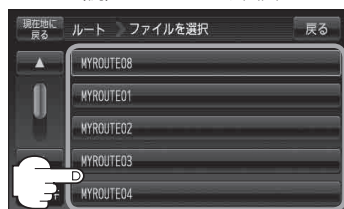
(例) ファイルリスト画面