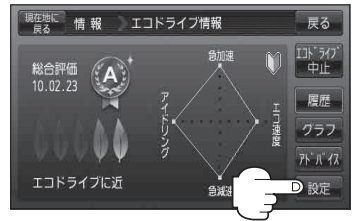
(例)エコドライブ情報画面