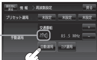
(例)周波数設定画面

VICSの受信状態を表示 3つの輪がオレンジ になると放送局を受信 することができます。