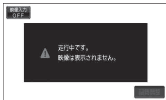
(例)ビデオ画面(走行中)