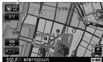
(例) 現在地表示画面