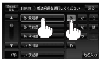
都道府県リスト画面