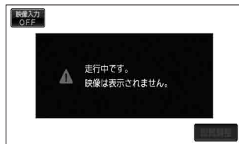
(例)ビデオ画面(走行中)