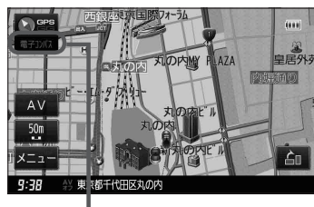
電子コンパス状態表示