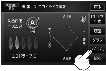
(例)エコドライブ情報画面