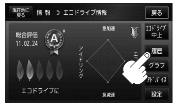
(例)エコドライブ情報画面