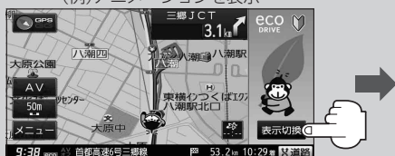
(例) アニメーションを表示