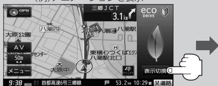
(例) アニメーションを表示