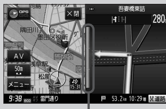
(例) 交差点拡大表示

・ データは地図ソフト作成時のものであるため、表示された内容(ランドマークなど)が実際とは異なる場合がありますので、ご注意ください。