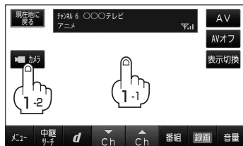
(例)テレビ視聴(ワンセグ)画面