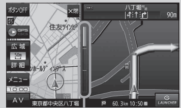
(例)交差点拡大表示