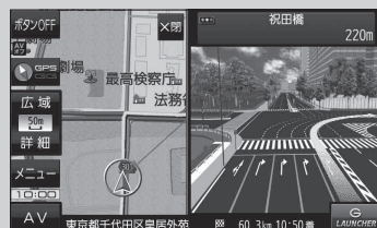
(例) リアル3D交差点表示