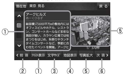
(例)施設の詳細画面