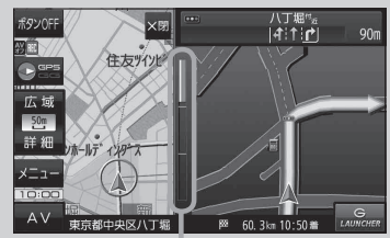
(例)交差点拡大表示