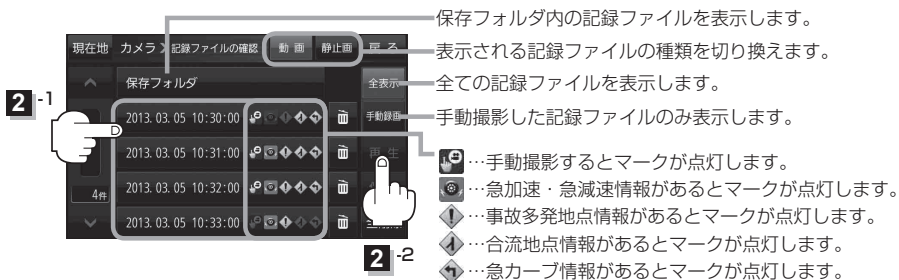
(例)記録ファイル(動画)再生画面