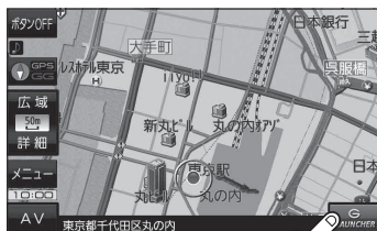
(例) 現在地の地図画面(AV音量バー表示)

※ LAUNCHER が非表示で、 音量 を表示している場合は 音量 をタッチしてください。