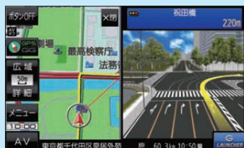
(例) リアル3D交差点表示