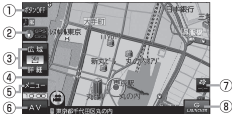
(例) 現在地の地図画面