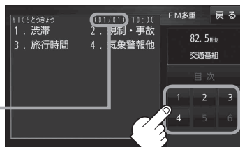
(例)文字情報の目次画面

2ページ以上ある場合は、画面を送って、 見たい情報のある画面を表示してください。