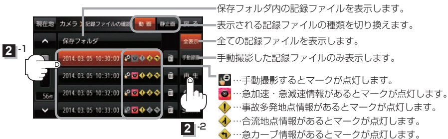
(例)記録ファイル(動画)再生画面