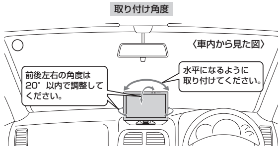
取り付けスペース

ナビゲーション本体の取り付けには、下記の角度および取り付けスペースを参考にしてください。