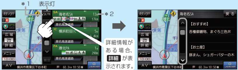
情報の続きを表示