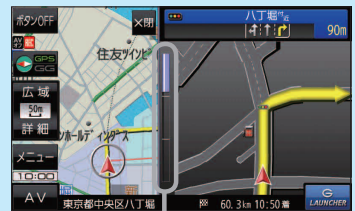
※バーの長さで交差点までの距離を表します。