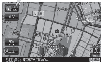
(例) 現在地表示画面