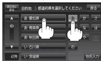
都道府県リスト画面