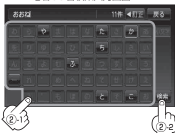
地名50音検索入力画面* 2