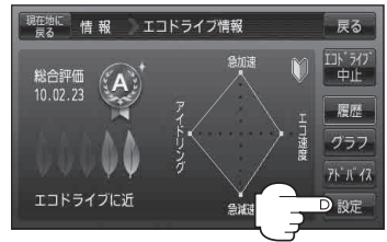
(例)エコドライブ情報画面