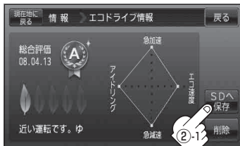
(例)エコドライブ評価履歴の詳細画面