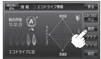
(例)エコドライブ情報画面