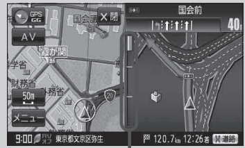
(例) 交差点拡大表示