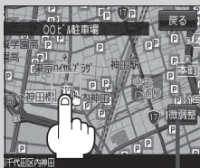
微調整 ボタン [B-17]