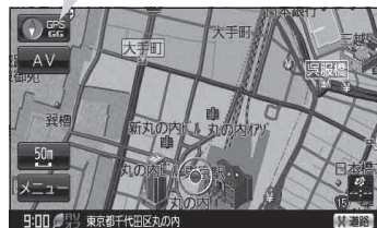
(例) 現在地表示画面