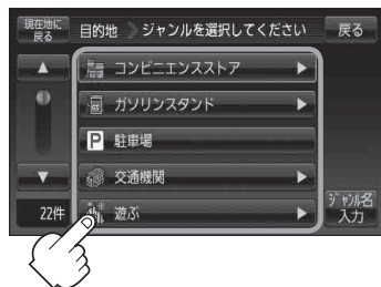
ジャンル選択画面