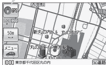
(例) 現在地表示画面