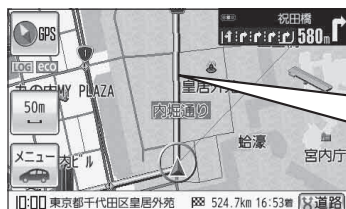
(例)ルート案内画面