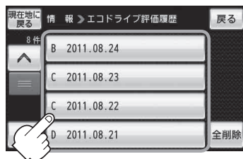
(例)エコドライブ評価履歴画面